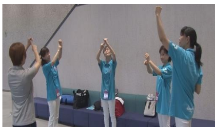
手話サークルのピッチアシストと