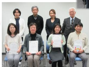
← 通訳II課程 修了者4名

聴こえの相談 江北町巡回聴こえの相談 4月19日(水) 午前10時～午後3時 会場：江北町役場内会議室(要予約)