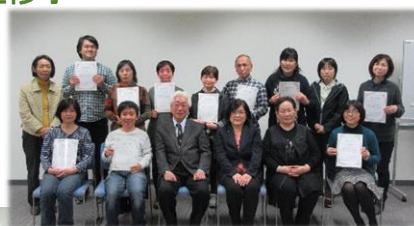
通訳I課程 修了者10名

3月26日(日)に手話通訳者養成講座通訳I・通訳IIの合同修了式が行われました。