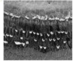
耳が聞こえづらくなった時