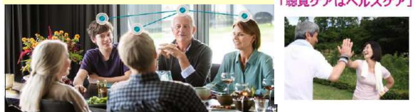
「聴覚ケアはヘルスケア」